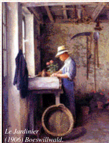
Le Jardinier (1906) Boeswillwald.