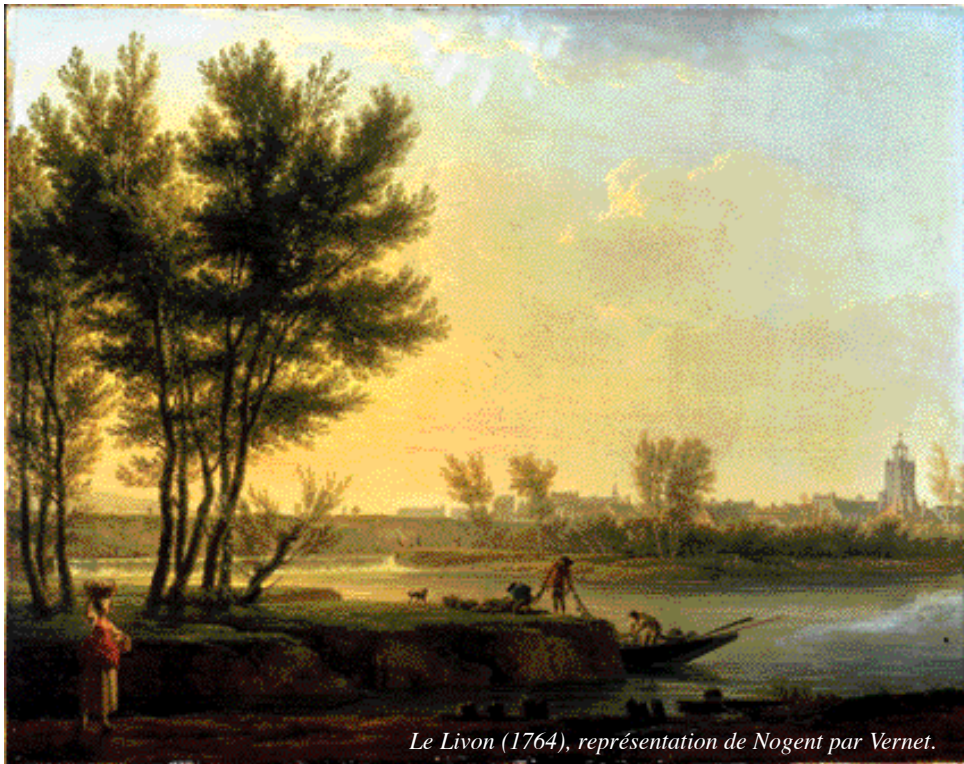
Le Livon (1764), représentation de Nogent par Vernet.