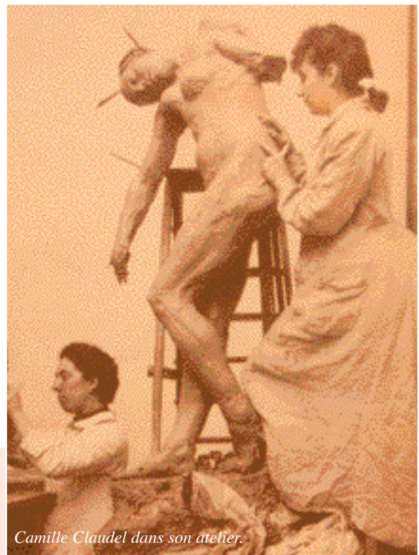
Camille Claudel dans son atelier.

Claudel ! Une révélation pour beaucoup. Riche de ses collections de sculptures, entre autres,