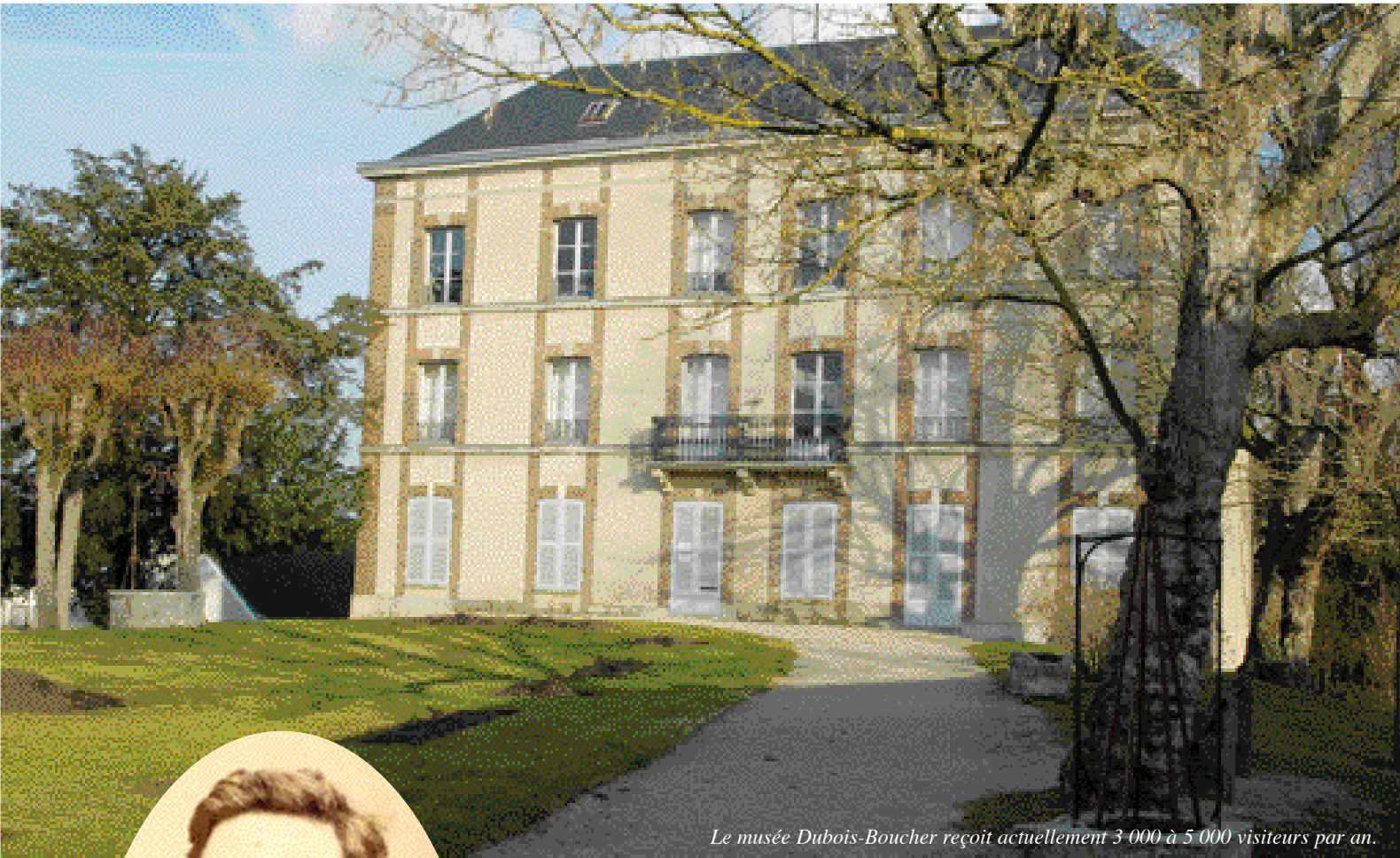
Le musée Dubois-Boucher reçoit actuellement 3 000 à 5 000 visiteurs par an.