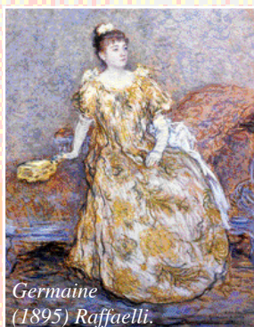
Germaine (1895) Raffaeilli.