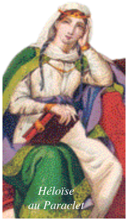
Héloïse au Paraclet

Un grand écrivain, Flaubert, a même choisi cette ville pour cadre de l'un de ses plus fameux romans. La région est riche aussi de monuments et de curiosités formant un ensemble remarquable.