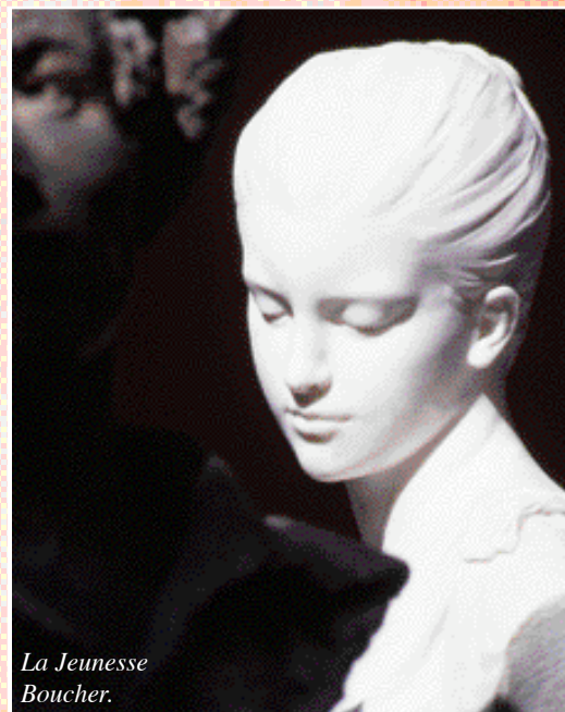
La Jeunesse Boucher.