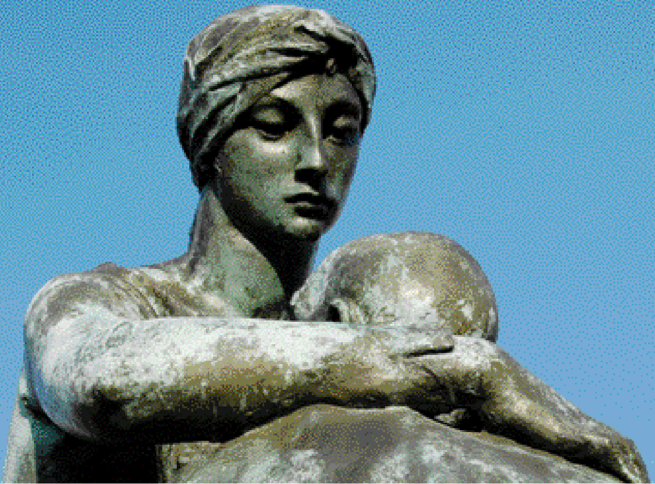
La Piété filiale d'Alfred Boucher (détail, ci-dessus) et La Charité de Paul Dubois (ci-dessous).