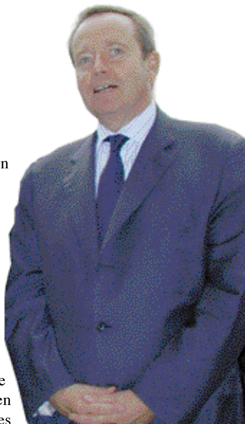
Renaud Donnedieu de Vabres, ministre de la Culture et de la Communication, promoteur de la loi sur le mécénat.

Sur un budget global de 1,2 million d'euros, celle-ci a apporté 30 490 euros. Mais la contribution du mécène ne se limite pas à cette enveloppe financière. La fondation a par exemple organisé une exposition itinérante consacrée au chantier de Villenauxe et continue à promouvoir cette opération hors du commun en particulier auprès des médias. Commencés en juillet 2003 et achevés en octobre 2005,