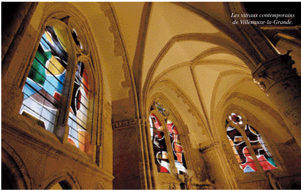
Les vitraux contemporains de Villenauxe-la-Grande.

N ogent-sur-Seine et sa région fourmillent d'églises remarquables. L'église Saint-Laurent (XV e et XVI e ) renferme plusieurs œuvres des sculpteurs nogentais, ainsi qu'un grand orgue classé Monument historique. Construite en grès, la collégiale Saint-Pierre-et-Saint-Paul de Villenauxe-la-Grande (XIII e -XVI e ) est ornée depuis peu d'un magnifique ensemble de vitraux modernes, le plus important réalisé en