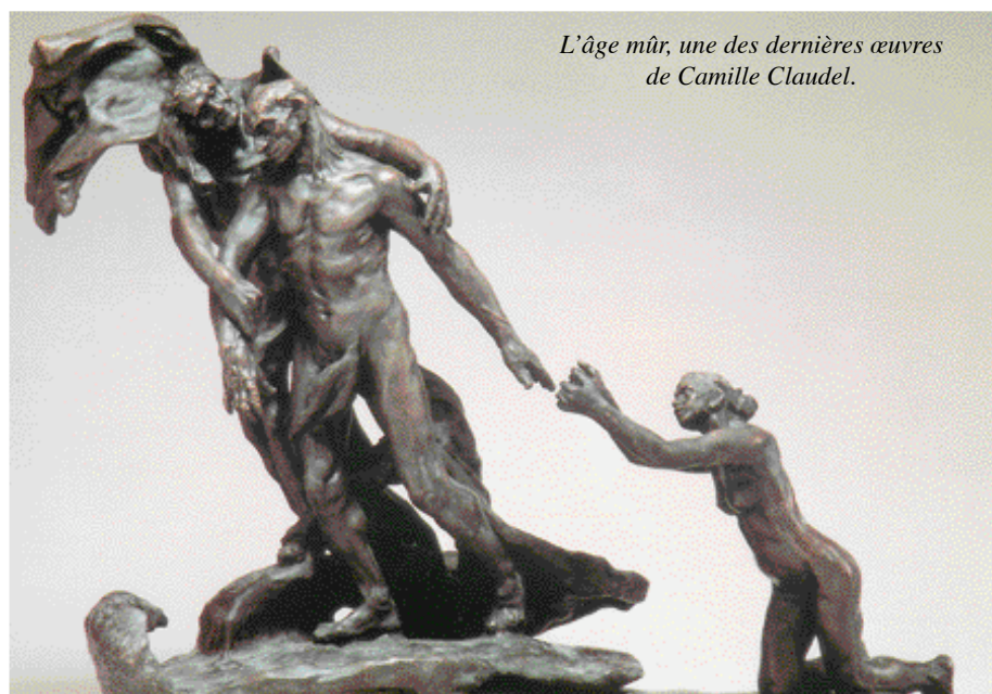
L'âge mûr, une des dernières œuvres de Camille Claudel.