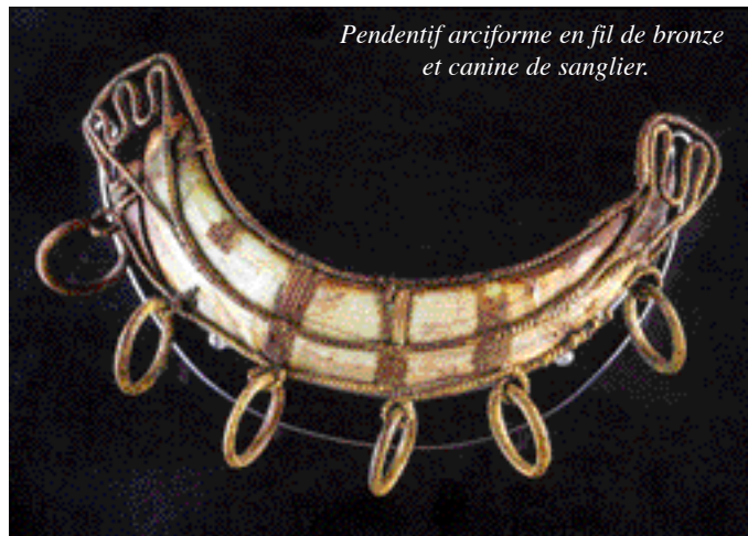
Pendentif arciforme en fil de bronze et canine de sanglier.

colliers et des bracelets constitués de perles d'ambre, des céramiques et un important matériel osseux (restes de faune et près de 150 squelettes humains). Une grande partie de ces objets proviennent du site de Frécul à Barbuise et à La