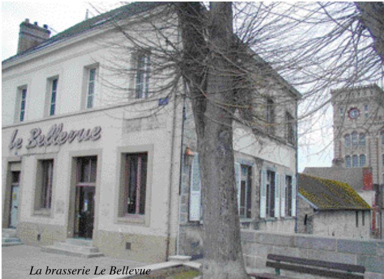
La brasserie Le Bellevue