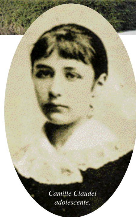
Camille Claudel adolescente.