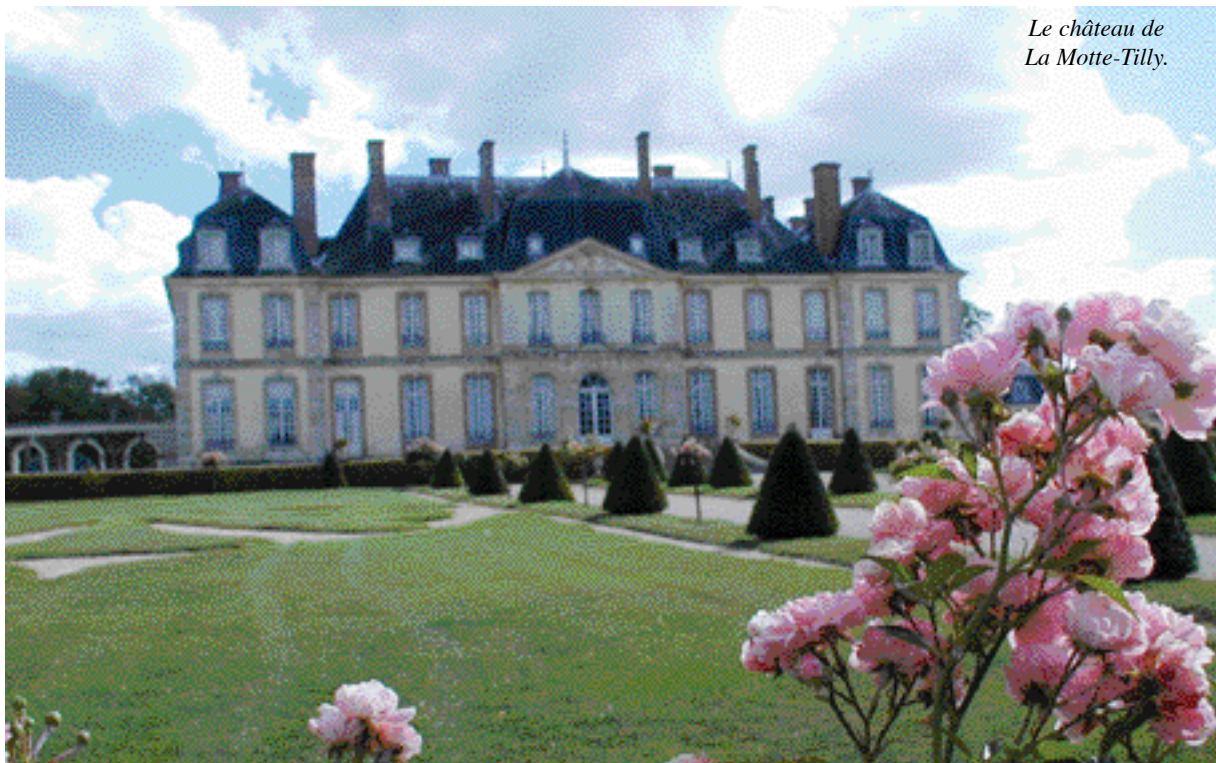
Le château de La Motte-Tilly.

France ces vingt dernières années. L'église Saint-Martin de Pont-sur-Seine (XII e -XVI e ) a ceci d'extraordinaire que son intérieur est entièrement revêtu de peintures exécutées en 1636 attribuées à Lesueur. La Villeneuve-au-Châtelot possède la seule église fortifiée de l'Aube (XII e -XVI e ). Dernière curiosité, l'église de Dival a été désacralisée pour héberger un centre d'expositions.